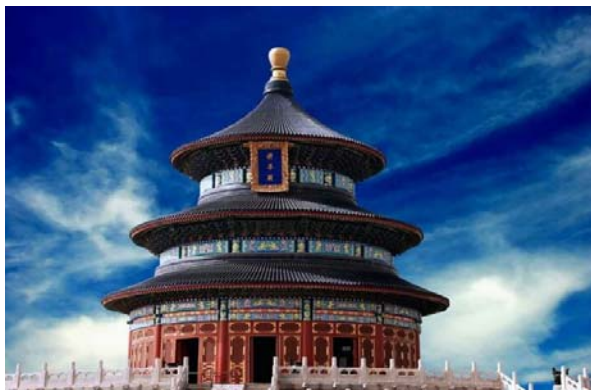
Рис. 4. Храм Неба в Пекине

Сегодня Пекин – столица Китайской Народной Республики с населением более 21 млн чел. История города началась, как писали выше, более 3 тыс. л. н., когда появился обнесенный стенами город Цзи – столица царства чжоусцев Янь, на месте которого и был построен современный Пекин [17, с. 209]. Чжоусцы по традициям своих предков, кочевников жунов и ди , обустроили на холме место прошения у Неба урожая. Современный Храм Неба в Пекине был построен с 1406 по 1420 г. по указу императора Юнлэ из династии Мин (рис. 4).