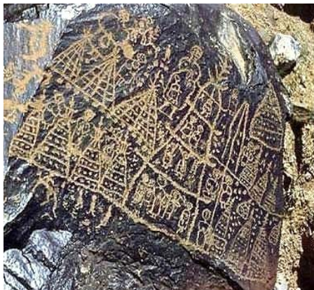
Рис. 1. Наскальные рисунки Иншань возрастом более 4 тыс. лет 2

Современные кумысные праздники Ысыах в Якутии сохраняют концепцию Ысыаха, изображенного более 4 тыс. л. н. Также ставится Мировое дерево Аал Луук мас , располагаются Могол Ураса (юрты) (рис. 2).