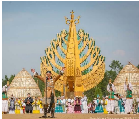
Рис. 2. Ысыах Олонхо в с. Намцы, Якутия, 2019 г.

Но как проходил ритуал у хуннов? В. С. Таскин пишет: «Утром шаньюй выходит из ставки и совершает поклонение восходящему солнцу, вечером совершает поклонение луне. Когда садится, то обращается лицом на север, и левая сторона от него считается почетной» [15, с. 40]. Из этого отрывка видно, что алгысчытом , проводящим ритуал, выступает сам шаньюй . В якутском обряде алгысчыта выступали предводители, почетные старейшины, знатоки традиции.