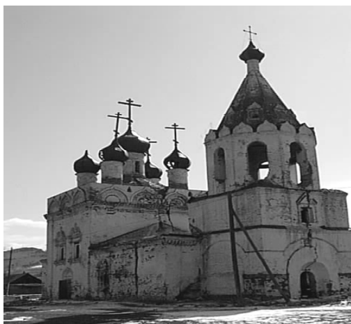
Рис. 2. Церковь Нерчинского Успенского монастыря. Возведена в 1712 г.

Автору статьи в процессе работы с архивными документами удалось составить подробный перечень и расположение икон иконостаса холодного Успенского придела, а также двух иконостасов теплых приделов. Собранная информация может оказать большую практическую помощь не только в понимании специфики социокультурной среды Нерчинска того периода времени, но и позволит исторически верно реконструировать внутренний интерьер уникального памятника культового зодчества Сибири начала XVIII в. для тех, кто впервые обращается к проектированию убранства интерьеров православных храмов (рис. 2).