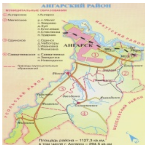
Рис. 1. Административно-территориальное деление АМО

Значимые предприятия Ангарска и АМО – это ОАО «Ангарская нефтехимическая компания» (АНХК), ОАО «Ангарский электролизно-химический комбинат» (АЭХК), ОАО «Ангарский завод полимеров» (АЗП), ОАО «Ангарский цементно-горный комбинат» (АЦГК), ОАО «Ангарское управление строительства» (АУС), ОАО «Каравай». Объем выручки от реализации продукции этих предприятий в 2008–2012 гг. представлен в табл. 1.