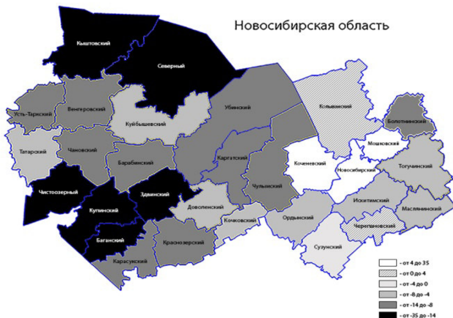
Рис. 2. Средний миграционный прирост или убыль населения в муниципальных образованиях Новосибирской области за 2005–2015 гг., %о [1]

Для муниципальных районов Новосибирской области характерна миграционная убыль населения. Наибольшая убыль населения за исследуемый период была зафиксирована в муниципальных районах, наиболее удаленных географически от регионального центра и других крупных городов соседних территорий: Кыштовском, Северном, Чистоозерном, Купинском, Баганском, Здвинском. Муниципальные районы, находящиеся в непосредственной близости от регионального центра, являются миграционно привлекательными территориями. Однако замещение выбывающего коренного населения в этих районах происходит главным образом за счет населения, прибывающего из стран СНГ (рис. 2), что часто является неэквивалентным по образовательному и квалификационному статусу.