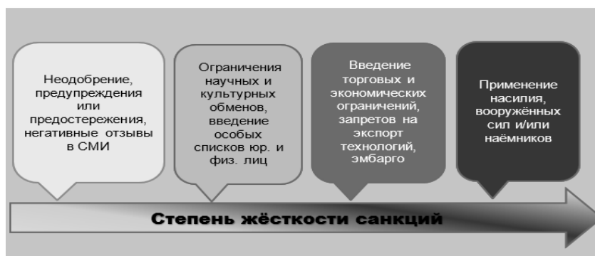
Рис. 2. Градация санкций по уровню жесткости

Однако, несмотря на это, сотрудничество РФ и КНР крепнет. Более того, влияние Китая на регионы Восточной Сибири РФ, в частности на Забайкальский край, очень велико. КНР практически определяет экономическое будущее и развитие данного региона, тем самым делая его полностью зависимым от экономики Китая. Такое тесное сотрудничество может привести к «стиранию» границ между приграничными регионами, что в свою очередь ведет к потере его идентичности, а также массовому притоку китайских граждан на территорию Забайкальского края. В связи с этим необходимо более детальное